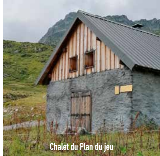
Chalet du Plan du jeu