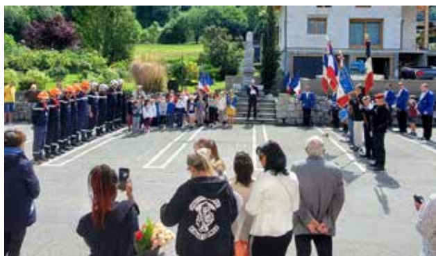
▲ Commémoration du 8 mai