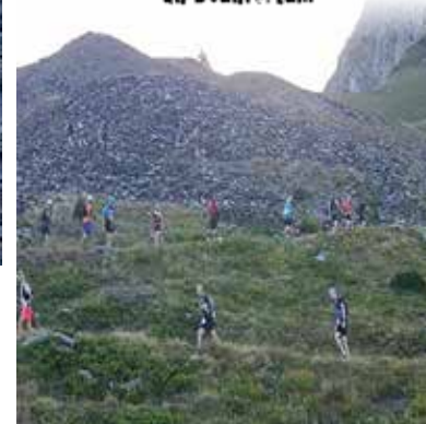
Les concurrents aux Ardoisières de Cevins