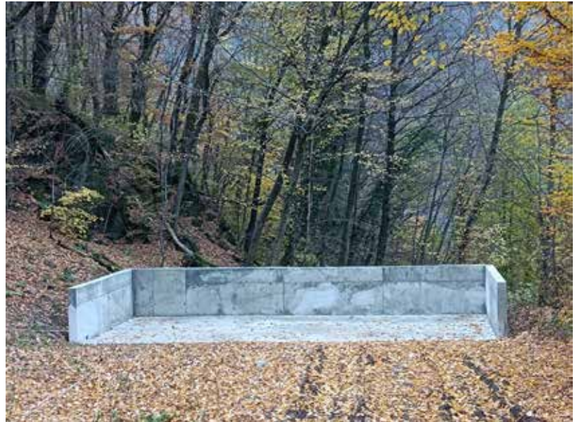
▲ Box à fumier au chagney

“Une année bonne et l'autre, non ! chantait le poète “. Si la quantité n'est pas très grande, la qualité, en revanche, s'annonce exceptionnelle. C'est plutôt réconfortant après la saison calamiteuse de 2021. Le coteau a échappé, fort heureusement aux gelées de printemps ainsi qu'à la grêle. Un petit bémol, cependant : La longue sécheresse de cet été a été fatale à beaucoup de jeunes plants qu'il va falloir replanter.