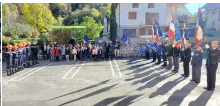
▲ Commémoration du 11 novembre