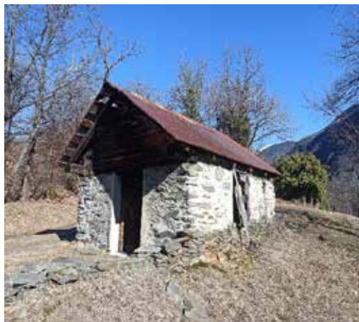
◀ Les sartos avant les travaux de cet hiver (toiture)