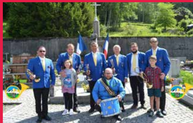
5 membres absents sur la photo

Le Président et l'ensemble de l'Écho de Sècheron