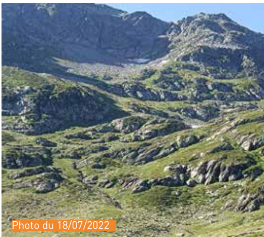
Photo du 18/07/2022

Cette observation faite par pur hasard, fait écho au réchauffement climatique.