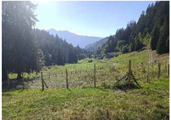
▲ Clôture autour de la cuve et protection de la chambre de vanne de Bénétant réalisée bénévolement en juillet 2022