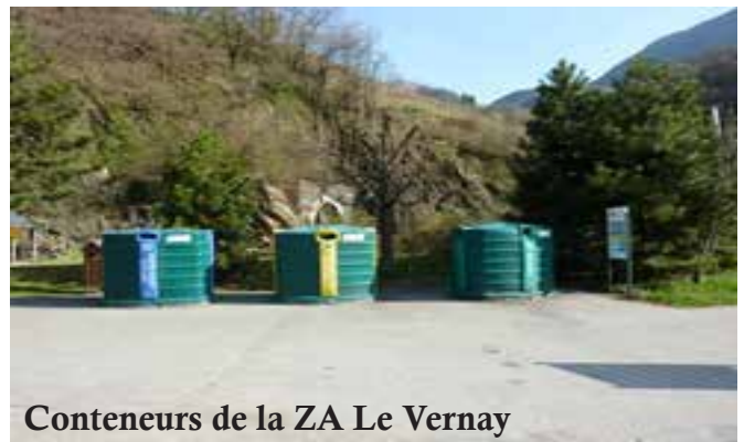
Conteneurs de la ZA Le Vernay

Et le conteneur vert , c'est pour le verre. Mais attention à ne mettre que le verre des emballages ménagers tels que bouteilles, pots et bocaux. Tous les autres types de verres comme la vaisselle (y compris le verre à boire !), les ampoules, les vitres y sont refusés et doivent être déposés en déchèterie.