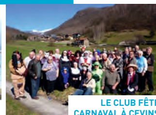
LE CLUB FÊTE CARNAVAL À CEVINS