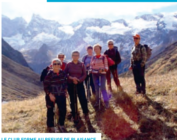
LE CLUB FORME AU REFUGE DE PLAISANCE