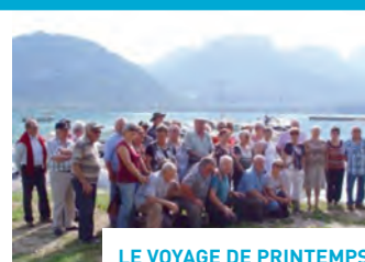
LE VOYAGE DE PRINTEMPS