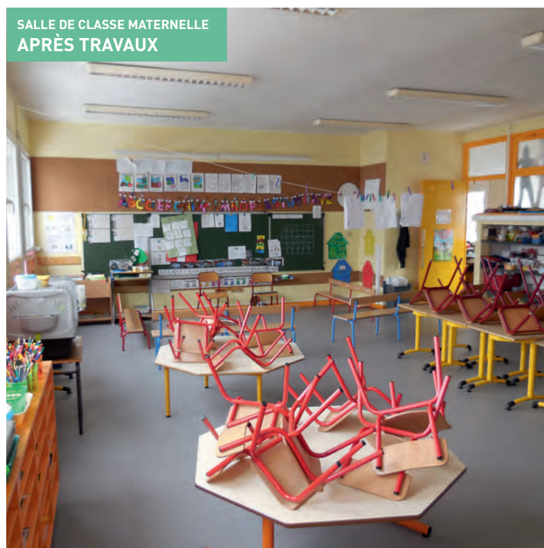
SALLE DE CLASSE MATERNELLE APRÈS TRAVAUX