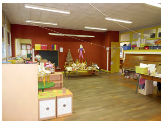
SALLE DE CLASSE MATERNELLE AVANT TRAVAUX

Montant des deux interventions : 2639 € TTC .